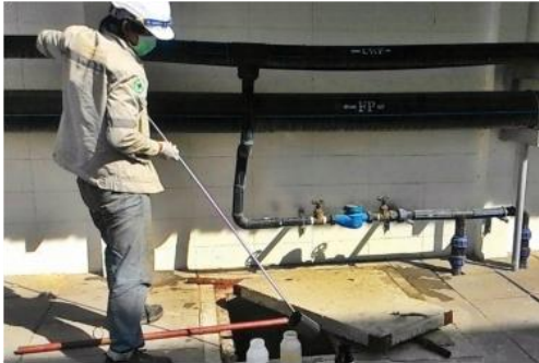
ตรวจวิเคราะห์คุณภาพน้ำเสียน้ำทิ้ง