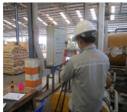
ตรวจวัดความร้อน