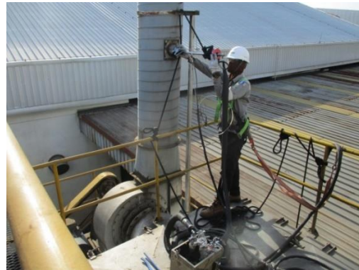
ตรวจวัดอากาศในปล่องระบาย