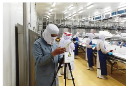
ตรวจวัดเสียง