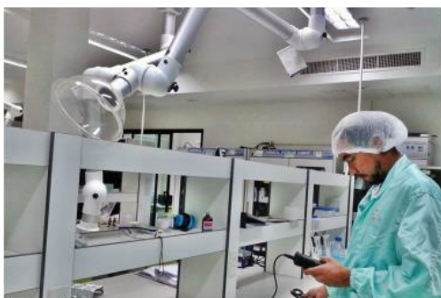
ตรวจวัดแสงสว่าง