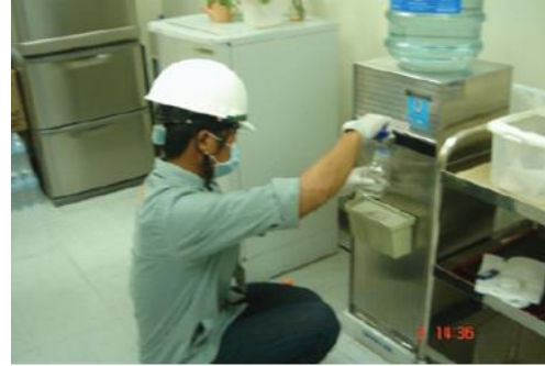
ตรวจวิเคราะห์คุณภาพน้ำดื่ม