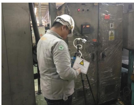
ตรวจวัดฝุ่นละออง